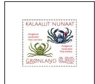
Hyas coarctatus et Hyas araneus